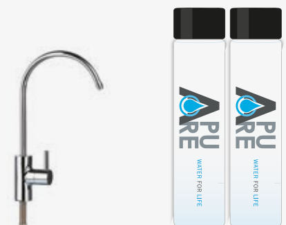
ROBINET - FAUCET