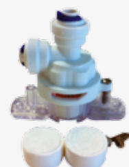
Antifuite Mécanique Mechanic anti-flood System