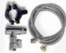
Kit d installation Installation Kit