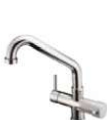
ROBINET - FAUCET Mono-commande - a 5 voies - bas Single-control - Five-way mixer tap - low cane