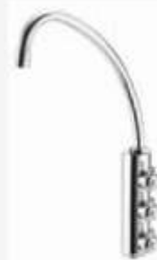
ROBINET - FAUCET