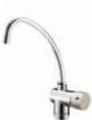
ROBINET - FAUCET 3 voies 3 water