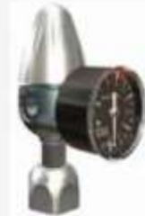
Réducteur pour bombe de CO2 avec manomètre de pression. Reducer for rechargeable gas cylinders with axial low pressure gauge