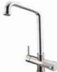
ROBINET - FAUCET Mono-commande - a 5 voies - haut Single-control - Five-way mixer tap - high cane